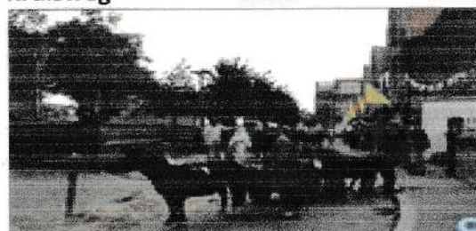
Kruisweg anno 2010