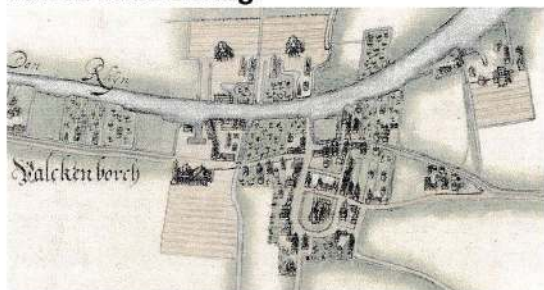
Plattegrond ca. 1600

De kruisweg, één van de oudste straten in ons dorp, loopt van de Broekweg ten zuidwesten van de kerk naar het begin van de Middenweg.