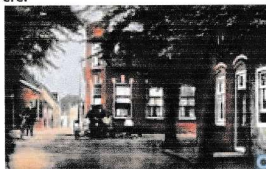
Kruisweg anno 1930