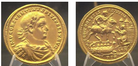
Deze gouden munt toont de verovering van Londen op bevel van Constantius.

Constantius richt zijn vizier vervolgens op de Franken, die zich als bondgenoten aan deze Allectus hadden opgeworpen. In 295 behaalt hij een aantal overwinningen tegen hen in het (voormalige) stamgebied van de Bataven – in de buurt van Valkenburg dus. ii Als dat probleem eenmaal is opgelost heeft hij zijn rugdekking voor elkaar en zijn handen vrij om een invasie van Brittannia te gaan voorbereiden. Daar verslaan en doden troepen onder zijn bevel Allectus. Vanuit het opnieuw bezette Londen als uitvalsbasis rekt Constantius aansluitend af met dolende Frankische huurlingen van Allectus.