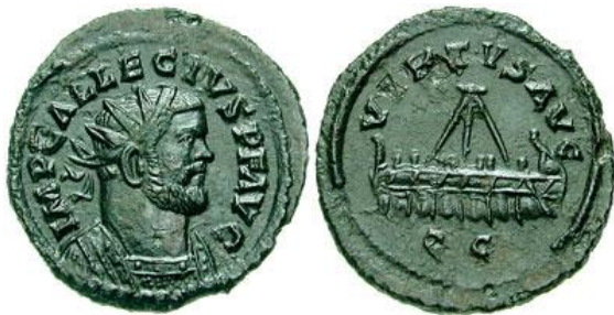
De munt met Allectus bracht op een veiling ruim 500.000 pond op.

zijn uitvalsbasis en trekt vandaar ten strijde tegen de Romein Carausius, die zichzelf in 286 in Noordwest Gallië tot keizer heeft uitgeroepen. Die strijd verloopt succesvol voor Constantius. Eind 293 verslaat hij Carausius en neemt hij diens havenstad Boulogne-sur-mer in. Carausius neemt de wijk naar Brittannia, alwaar hij door zijn eigen minister van financiën, de marine-officier Allectus wordt vermoord.