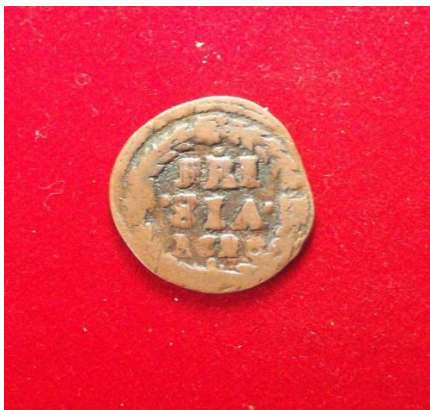
de Friese duit.

Elke provincie in de Zeven Provinciën had zijn eigen munstslag. De Friese duit is geslagen in de Friese munt in Leeuwarden. Die werd in 1580 opgericht en heeft bestaan tot 1752. Een doorslaand succes is dat munthuis nooit geworden. Dit is te wijten aan het feit dat edelmetaal in Nederland over zee moest worden aangevoerd. Munthuizen die dicht bij de havens lagen, konden hun munten goedkoper produceren dan verder weg gelegen muntsteden zoals Leeuwarden.