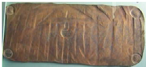
plaatgeld uit Zweden

Wacht even – die munt van 1 öre was al een flinke jongen. Hoe groot moet een munt met een waarde van 48 öre dan wel niet zijn? Zo'n koperen daler woog 650 gram. Daarvoor moet je een stevige beurs hebben. Naarmate het zilver schaarser en