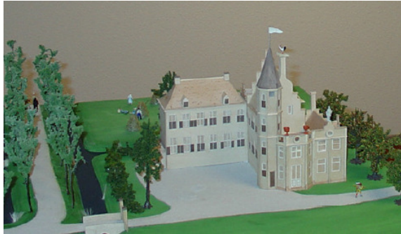
maquette huize Torenvliet.