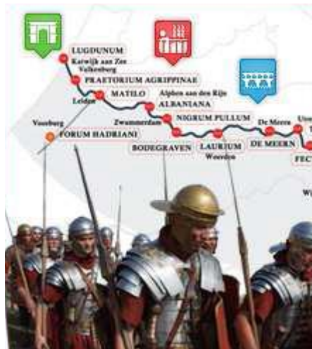
Een keten van castella langs de Rijn

Het vermoeden is, dat de forten in de beginperiode vooral werden ingezet om het handelsverkeer op de Rijn tegen piraten te beschermen, terwijl de nadruk later meer kwam te liggen op het tegenhouden van indringers. “Maar we weten het niet zeker. Je zou bijvoorbeeld zeggen dat marinepatrouilles effectiever zijn tegen piraten dan forten. Valkenburg was het enige fort in het westen waar ruiters waren gelegerd. Dat is enerzijds logisch omdat de andere forten in (nog) moerassiger terrein lagen waar ruiters niet uit de voeten kunnen. In Valkenburg zouden die ruiters in de duinstrook ten noorden van de Rijn kunnen opereren. Maar wat ze daar dan deden, dat weten we ook weer niet.”