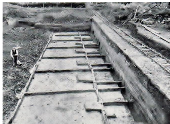
Opgraving uit 1942 van soldaten barakken.

Het blijft staan dat hier het meest compleet onderzochte fort in de Nederlandse limessector is opgegraven. Het gaat om het iconische Nederlandse limesfort – dat internationaal veel erkenning krijgt.”