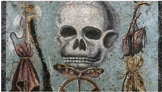
mozaïek uit Pompeï.