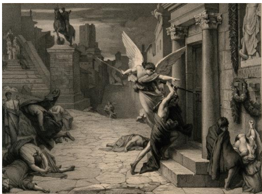
De engel des doods waart rond.

Van 249 tot 262 komt de gesel van een besmettelijke ziekte wederom neer op het rijk, mogelijk in de vorm van een ernstig influenzavirus. Deze zogeheten 'pest van Cyprianus' is genoemd naar de bisschop Carthago. Diens biografie beschrijft de pandemie als volgt: "De ziekte overviel de mensen opeens en verspreidde zich sneller dan ze verwachtten, voedde zich met hun