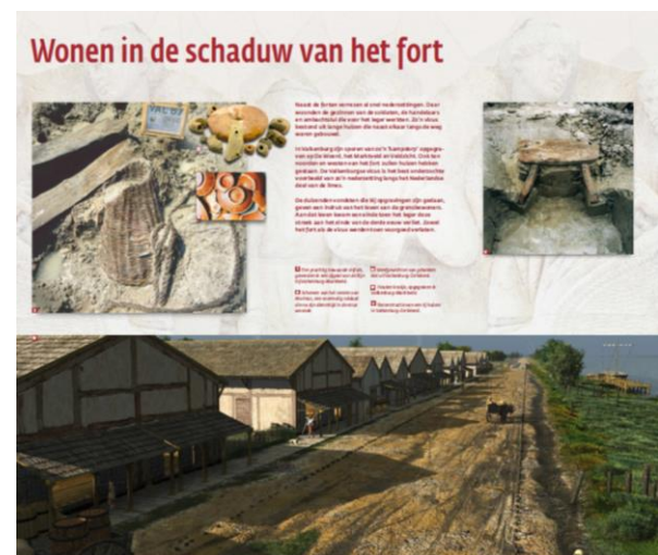
3e etage gaat over de bewoners in de vicus

Die kant van het verhaal, de hele burgersamenleving om het fort heen, krijgt in de nieuwe tentoonstelling meer nadruk. Van Ginkel: “De tentoonstelling gaat over iedereen die hier woonde en werkte. We weten dat die mensen een moestuin en een schuurtje hadden en hoe de bebouwing waarschijnlijk ononderbroken doorliep richting Katwijk.”