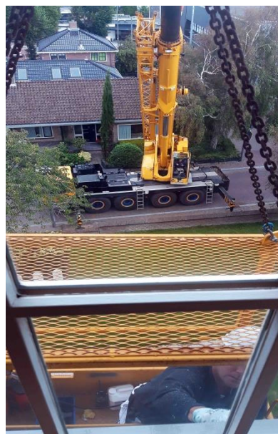
schilderwerk op hoog niveau.

Naast de inhoudelijke renovatie van de Romeinenexpositie werd ook het gebouw zelf aangepakt. De gemeente Katwijk was bereid het binnenwerk van het museum opnieuw te schilderen en van nieuwe vloerbedekking te voorzien. Deze werkzaamheden kwamen geheel voor rekening van de gemeente. Het werk werd zelfs uitgebreid met het schilderen van de buitenkant van de toren.