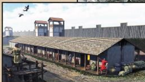
DE PARKEERVAKKEN STAAN BOVEN DE SOLDATENBARAKKEN.