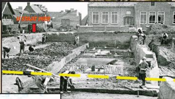
1941, OPGRAVING VAN HET CASTELLUM. ZICHTBAAR IS DE FUNDERING VAN DE OUDSTE WAL GEMAAKT VAN STAMMEN EN DAARACHTER EEN SOLDATENBARAK.