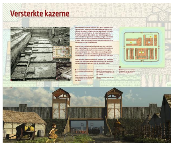
2e etage gaat over de soldaten in het Castellum

“Bij de laatste opgraving in 1980 bleek de waterhuishouding in de terp zodanig veranderd, dat de boel meteen instort als je nu gaat graven. De kansen zijn hier voorgoed verkeken – ook omdat het beschermd monument is, grotendeels overbouwd én grotendeels al opgegraven.”