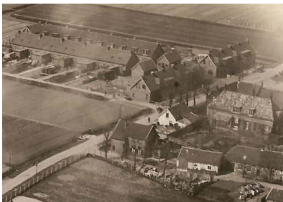
Katwijkerweg met de Rijnstroomlaan (begin jaren 30)