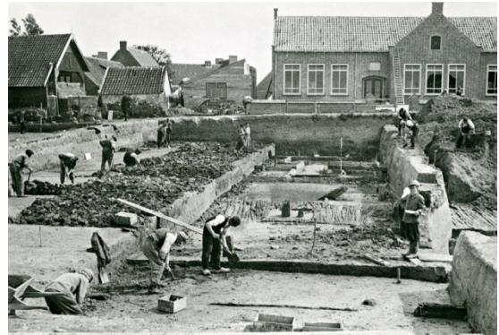
opgravingen op het (huidige) dorpsplein in 1942

De Valkenburgers gingen niet bij de pakken neerzitten en gingen voortvarend aan de slag. Toch ging alles niet van zelf, had men te maken met politieke problemen en moest men toestaan dat het herstel enigszins vertraagd werd door archeologische werkzaamheden. Er was een sterk vermoeden dat er een rijk Romeins verleden in de bodem van het dorp aanwezig was.