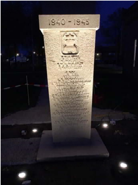
de aangelichte zuil