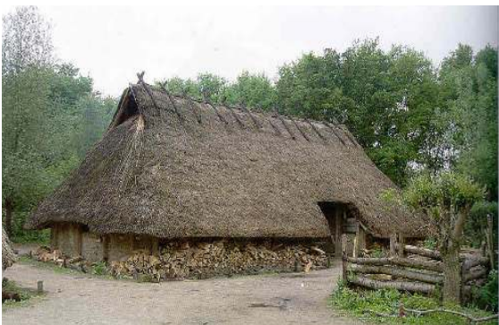
Boerderij rond het jaar nul.

In ongeveer 2500 v. Chr. trekt de zee zich terug naar het westen. Daardoor wordt het gebied van het voormalig Vliegkamp Valkenburg land. Nou ja, land... De delta van de Oude Rijn is dan een zoetwater getijdengebied, een afwisseling van moeras, kreken en hier en daar wat hoger gelegen land. Vanaf ongeveer 1000 v. Chr. zien mensen er heil in om hier te gaan wonen en agrarische activiteiten te ontplooiën. Dat blijkt uit recente opgravingen op het zuidwestelijk deel van het vliegveldterrein.