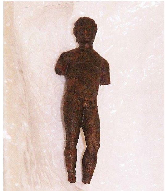
Is het Apollo? Is het Mercurius? Dit beeldje is in de huidige staat ongeveer 9 centimeter groot.

Dit keer had Mercurius geen kleren aan. Of ging het nu om Apollo? De gevleugelde helm waarmee Mercurius eigenlijk altijd wordt afgebeeld ontbrak in elk geval. Wat zeker is: door de vondsten van Marina is het aantal gevonden bronzen godenbeeldjes aan de Neder Germaanse limes significant toegenomen. Zij is nog altijd op dezelfde locatie aan het zoeken. Onlangs vond ze er nog twee munten. Waar het precies is? Dat geeft ze liever niet prijs.