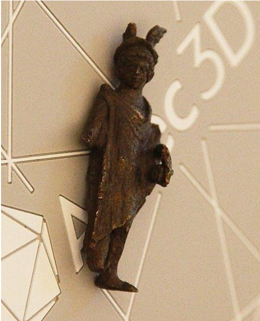
Mercurius: Nederlands Kampioen! Het beeldje meet ongeveer 7,5 centimeter.