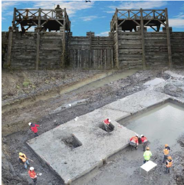
Het zichtbaar maken van ons Romeins verleden; als dat zou kunnen