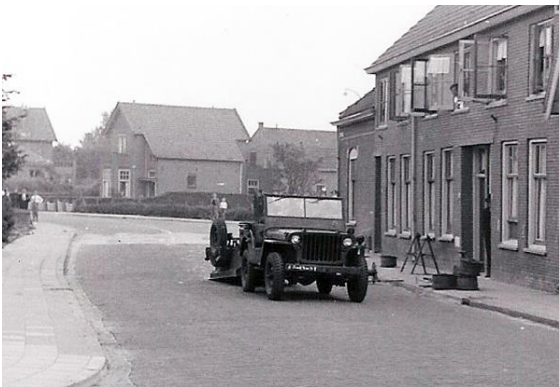
ter hoogte van de punt

Een twintigtal jongens stonden rond de Jeep met aanhanger. "Nou vooruit dan maar." De jongens lieten zich dat geen twee keer zeggen en sprongen in het karretje. Sommigen achterop de Jeep. Daar ging het gezelschap. Over de Hoofdstraat langs de Punt en de Pastorie naar garage Poot (nu Hoogvliet). Daar werd gekeerd en reed de Jeep weer terug. Een gejoel, gegil; het was toch wel spannend. Zeker toen het wat harder ging. En toen gebeurde het. Het karretje begon te slingeren en ter hoogte van de Punt raakte deze de stoeprand en sloeg om.