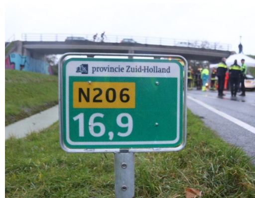
de huidige hectometerpaaltjes.

Nu maken we ons op voor de meest ingrijpende reconstructie in Valkenburg; de verdubbeling van de N206 met een verkeersknooppunt, die bijna dezelfde omvang heeft als het centrum van het dorp.