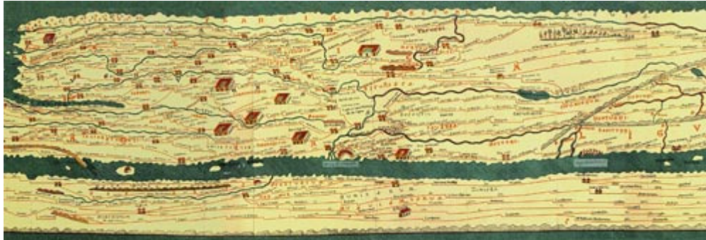
Deel Peutingerkaart (genoemd naar de eigenaar); kopie van kaart uit 4e eeuw

De meest recente opgraving in Valkenburg tussen de Achterweg en Tjalmaweg maakte een gedeelte van de Romeinse weg, ca. 125 meter, zichtbaar. De weg dateerde uit de 2e eeuw van onze jaartelling. Dat deze weg er lag was al eerder aangetoond. Samen met de Rijn vormde de weg de noord grens van het Romeinse rijk (Limes) in Nederland. Op een kaart, waarvan de oorsprong uit de 4e eeuw dateert staan de hoofdwegen in het Romeinse rijk aangegeven. De weg werd ook wel Heirbaan genoemd. Heir betekent leger. De wegen waren dan ook bedoeld om het leger snel te kunnen verplaatsen. Dat deze wegen eveneens goed bruikbaar waren voor het verplaatsen van personen en goederen lag voor de hand.