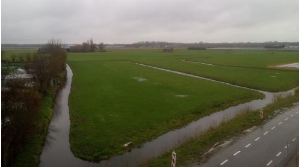
Het laatste stukje van de Broekpolder.

Het resultaat is dat op het laatste stukje Broekpolder nu als eerste gebouwd gaat worden (Buiten de hekken!!!).