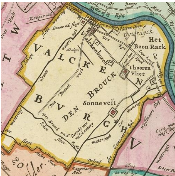
Kaart uit de 16e eeuw

De eerste aanslag op de polder vond plaats in 1937. De grote groene vlakte was uitstekend geschikt voor de aanleg van een vliegveld. Begin jaren 50 van de vorige eeuw werd het vliegveld aanmerkelijk uitgebreid. (De tweede aanslag).