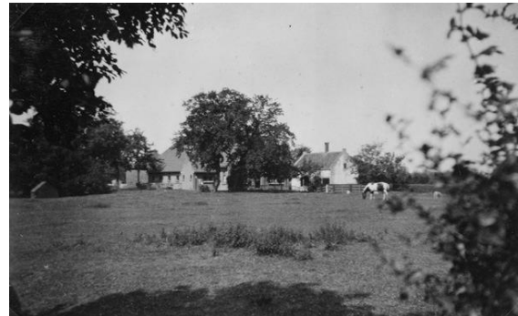
Boerderij behorende bij Torenvliet. Begin jaren vijftig gesloopt in verband met de uitbreiding van het vliegveld.

De lanen werden ook vooral gebruikt voor het bereiken van de akkers en weilanden in de Broekpolder. De buitens verdwenen en de bijbehorende boerderijen bleven over.