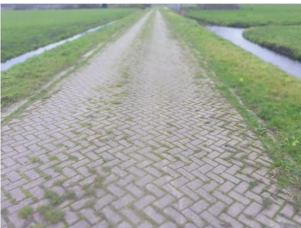
Uniek profiel (oude) Broekweg.