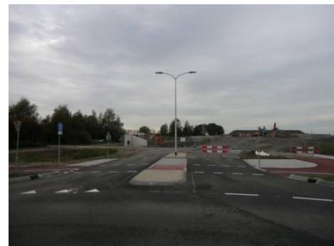
De transformatie van een historische plek tot..... Ja, tot wat eigenlijk