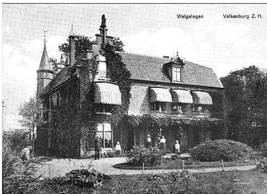
Het voormalig gemeentehuis in oude luister