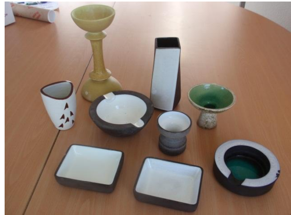
het aardewerk van Ravelli

gebruikt, voegen wij het graag toe aan de collectie in het museum.