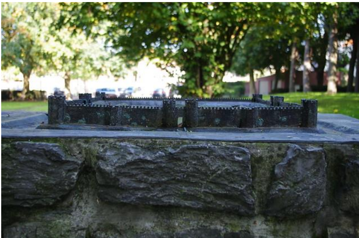
Bronzen maquette in Oudenburg, België

Wetenschappelijk verantwoorde bronzen maquettes in de buitenomgeving zijn een uitstekende manier om het verleden beleefbaar letterlijke voelbaar te maken – ook voor blinden en slechtzienden. Inmiddels heet Vereniging Oud Valkenburg al financiering van de Provincie Zuid-Holland ontvangen om drie bronzen maquettes te realiseren: één van een vroege bouwfase van het castellum, één van een wachttoren en één van het minifort. In het museum zelf wordt op de vierde verdieping een overzichtskaart van het hele gebied in de Romeinse tijd gerealiseerd. Op die kaart komen ronde maquettes die als het ware door een loep tot in detail laten zien hoe het er op die plek in de Romeinse tijd moet hebben uitgezien.