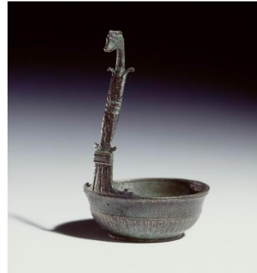
Bronzenwijnscheplepel, datering: 1ste – 3de eeuw na Chr., hoogte: 10,3 centimeter