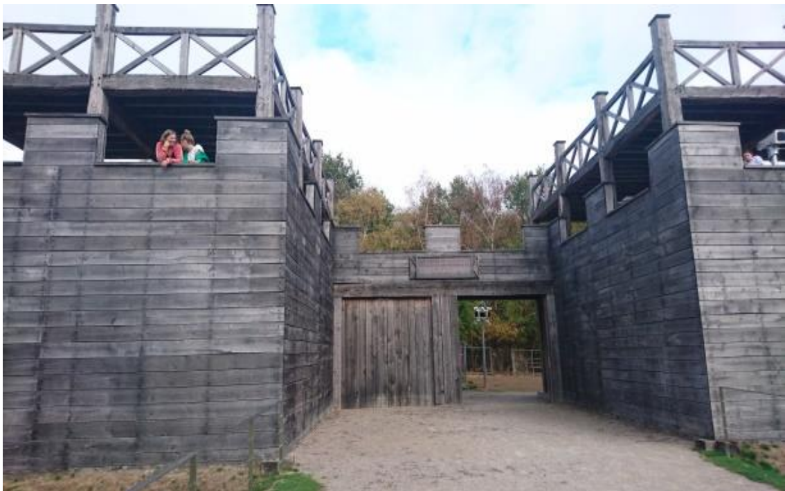
Reconstructie van een vergelijkbare gereconstrueerde Romeinse poort in Haltern am See. Op die plek in Duitsland is overigens het volledige castellum, inclusief dubbele spitsgrachten gereconstrueerd.

gebiedsontwikkeling van Valkenhorst worden ingepast. De poort zou bijvoorbeeld in een parkje in de nieuwe wijk kunnen worden gerealiseerd, waarbij het gereconstrueerde gebouw bijvoorbeeld een horecabestemming of "speelobject" zou kunnen krijgen.