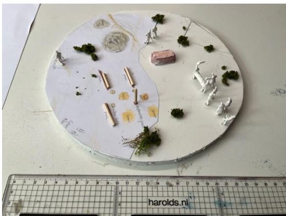
1 op 87 of 1 op 50?

De eerste stap richting het uitwerken van het schaalmodel was het bepalen van de schaal.