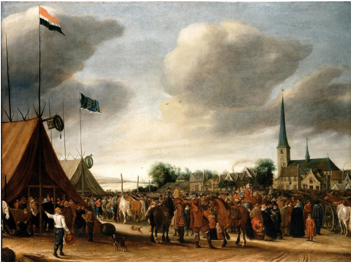
Salomon Ruysdael (1600-1670), Valkenburgse paardenmarkt, 1626,

Soo verr vier voeten gaen, vier voeten in ' t beslagh, Vier voeten in den dwangh van Ruyterlick gesagh, soo verr men ringht en springht, onthaelt men de geruchten Van mijn septemberfeest en weldoende genuchten. Die myne peteren mijn aanstaen had vertelt, sy hadden mynen naem in paardenburg vspelt. Gelyck het koren gaet op, door en uyt de moelen, soo treck, soo send ick uyt het meer en minder voelen. Wat dunckt u, vreemdelingh van ' t wedersyds verstand ? Heel Nederland vult my, en ick heel Nederland!