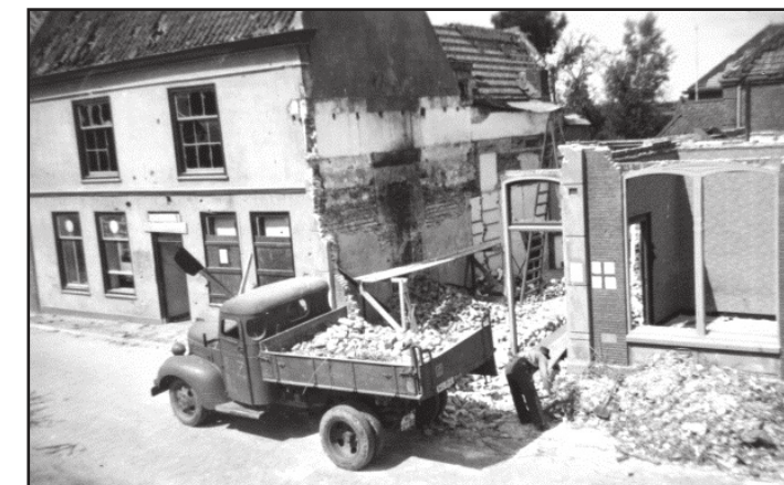
De sloop van woningen aan de Broekweg.

Professor Doctor Van Giffen kreeg van de Duitse bezetter alle kans om opgravingen te verrichten. Ook in 1942 en 1943 werden er opgravingen verricht, met een verbluffend resultaat. Maar liefst zes verschillende Castellums werden ontdekt.