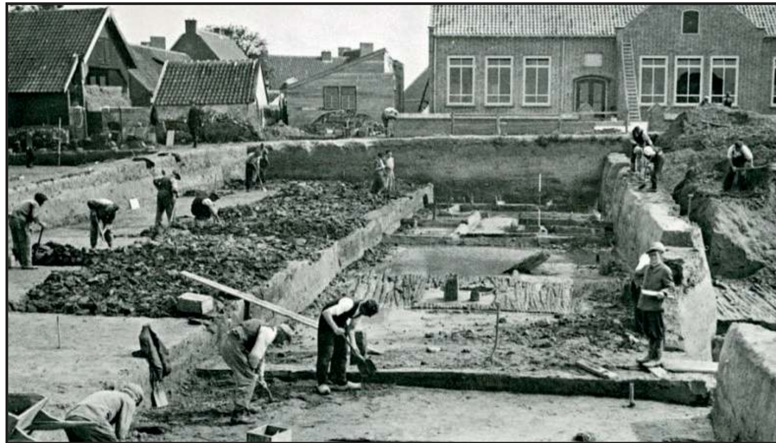
Opgravingen op het (huidige) Dorpshuisplein, met op de achtergrond de School met de Bijbel.

Vijf dagen oorlog bracht Valkenburg extreem veel leed. Een dorp met amper 1.000 inwoners, waar iedereen elkaar kent, moest 22 dorpsgenoten gaan begraven. De jongste slechts drie maanden, de oudste 66 jaar.