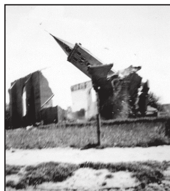
De val van de toren.