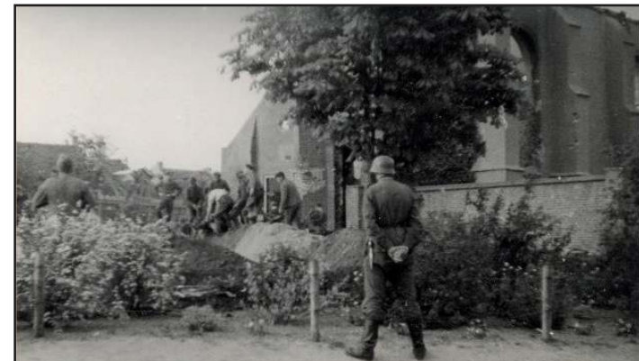
Het begraven van Duitse soldaten.

Dorpsgenoten, krijgsgevangenen en de bezetter waren die eerste dagen druk met het begraven van alle slachtoffers die er te betreuen waren.