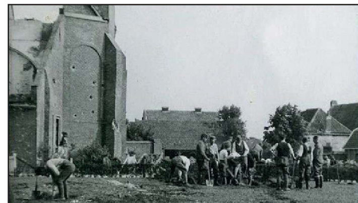
Het begraven van Hollandse soldaten.