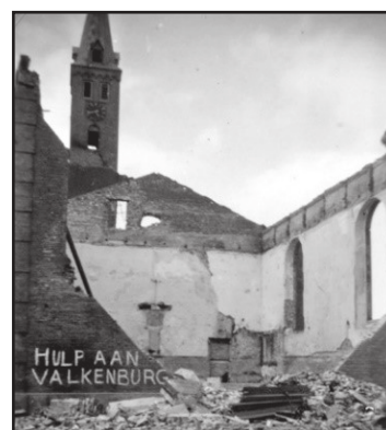
Hulp aan Valkenburg.

Met de nieuwbouw aan de Broekweg kon nog niet worden begonnen. De wetenschap zag namelijk in dat het platgegooid centrum een unieke kans was om onderzoek te doen naar het 'vermoedelijke' Romeinse verleden in Valkenburg.