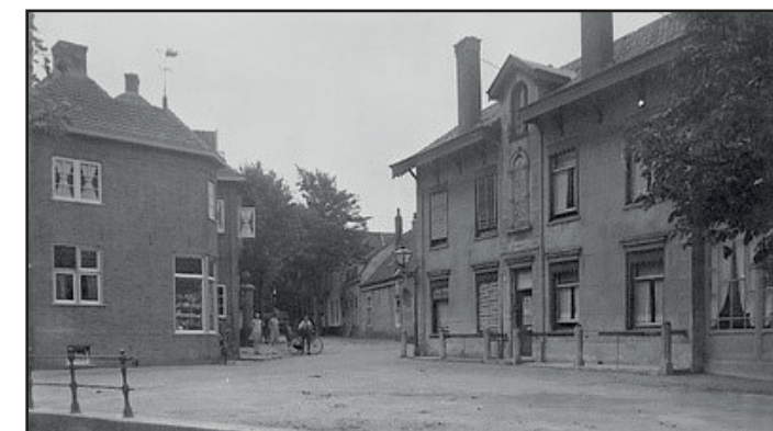
Het statige pand aan het Veepad.