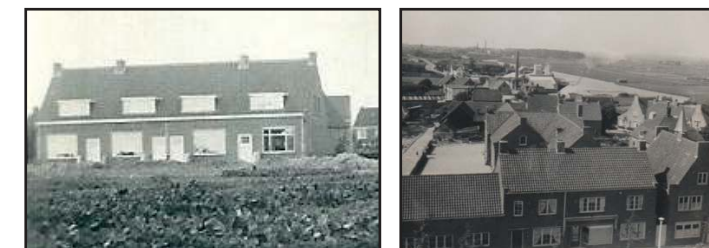
Nieuwbouw Lotsystraat en omgeving Broekweg.