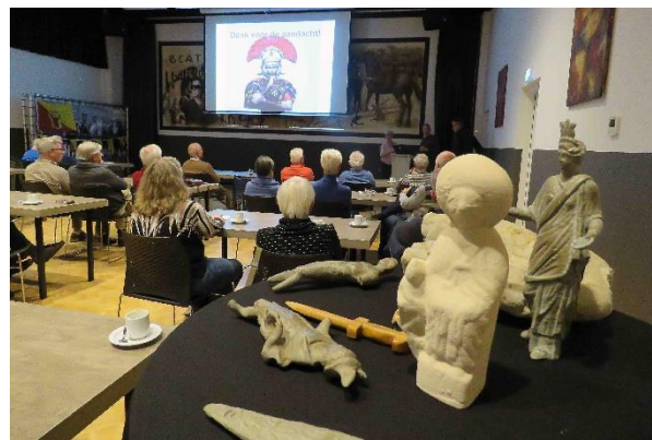
uitleg over zichtbare Limes

De plannen voor het uitbreiden van het Torenmuseum en het zichtbaar maken van het Romeinse verleden buiten het museum zijn verder uitgewerkt. De aangevraagde subsidie voor het zichtbaar maken van het verleden is grotendeels ontvangen.