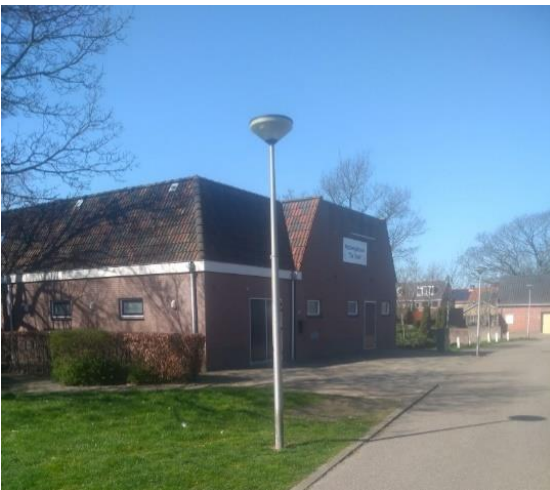
de eigen oefenruimte van Valkenburgs Harmonie