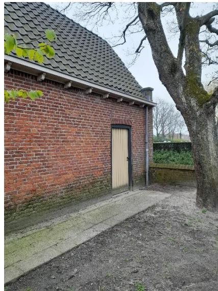
opslagruimte voor de VOV