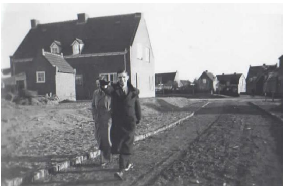
Op de foto de nieuwe Ringweg (nog onverhard) op de achtergrond de Kruisweg

In 1941 werd het 1 e wederopbouwplan vastgesteld met daarop twee nieuwe wegen. Eén daarvan is de Ringweg. Deze ligt in het verlengde van de Kruisweg en loopt met een boog naar de Hoofdstraat. De weg gold in de eerste plaats voor de ontsluiting van de in 1943 aangelegde nieuwe begraafplaats.