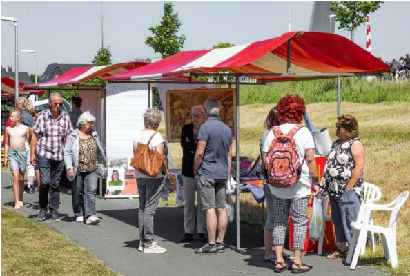
VOV op de markt In de dorpsweide

Op initiatief van de ijsclub werd op zaterdag 11 juni in de Dorpsweide een Markt Groot Valkenburg georganiseerd. Uiteraard was de VOV ook aanwezig met een kraampje en mede dankzij het mooie weer was het een geslaagde dag. Op deze dag is ook de nieuwe website met succes geïntroduceerd.