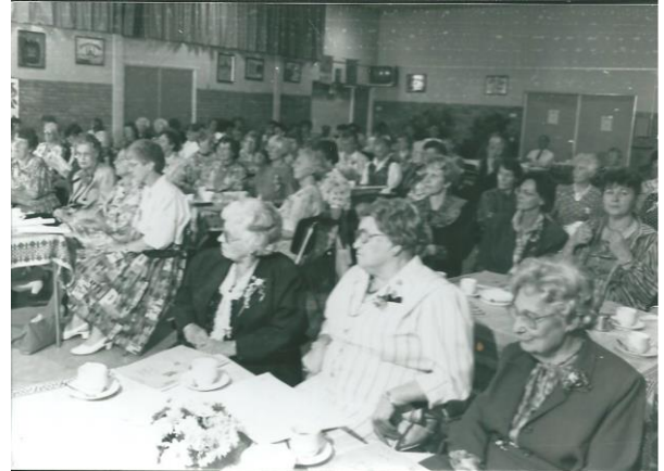
de vrouwenbond in het dorpshuis

Vanaf dat moment was dit het onderkomen van de harmonie. Maar ook van de volleybal - en gymnastiekvereniging De Valken. Daarnaast werden er vele activiteiten in de sportzaal georganiseerd. Het was een echt Dorpshuis.