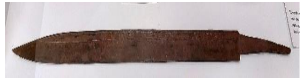
het Breit sax (zwaard)

Geen grote gebeurtenis maar wel het vermelden waard, is de terugkeer op 22 november van het gerestaureerde Breit sax (zwaard), zodat het na drie jaar weer kon worden tentoongesteld in de tijdelijk expositie.