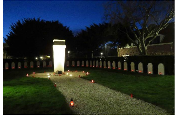
Erebegraafplaats op 24 december.