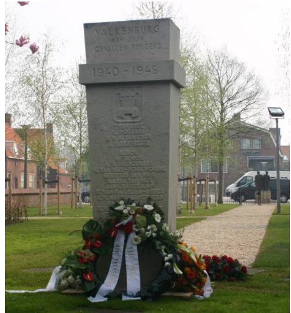
Het monument ter herinnering aan de burgerslachtoffers in de meidagen van 1940

Volgend jaar is het 80 jaar geleden dat er een einde kwam aan de tweede wereld oorlog. Dit wordt uitgebreid gevierd.