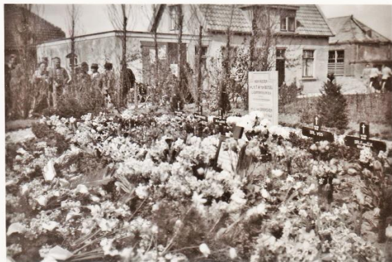
Een bloemenzee op de graven naast de Broekweg

In de vroege ochtend om zeven uur lagen verscheidende graven al vol met bloemen. Ook op Valkenburg waren door Valkenburgers kransen en bloemen op graven gelegd.