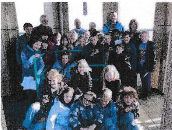
Groep 5A op de toren

In het kader van "Het grote woonproject" van de basisschool "De Burcht" bezocht groep 5A het Torenmuseum in Valkenburg. Voor de groep was binnen project gekozen voor het onderwerp "Wonen in Nederland". In het museum kregen de leerlingen van mensen van onze vereniging informatie over de geschiedenis van Valkenburg. Eerst maakten ze kennis met het leven in Valkenburg in de Romeinse tijd. Vervolgens zagen de scholieren aan de hand van luchtfoto's hoe Valkenburg in de afgelopen zeventig jaar is gegroeid en daarna kon iedereen vanaf de toren bekijken hoe alles er in werkelijkheid uit ziet. Tenslotte maakten de leerlingen een speurtocht langs de contouren van het castellum. Iedereen vond het programma leerzaam en interessant.