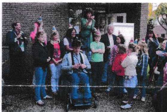
De organisatie en de kinderen die een deel van de expositie verzorgd hebben

Onder grote belangstelling en met het zingen van een lied is op donderdag 28 april j/l/ om 20.00 uur in het Torenmuseum de expositie "Muziek" geopend.