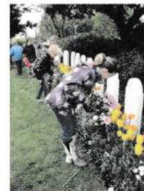
10 mei 2012; kinderen van de basisschool leggen bloemen.

In 2000 zijn de herdenkingen op 4 mei en Hemelvaartsdag samen gegaan. Dit had mede