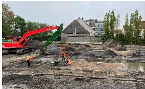
resten van pannembakkerij uit de 17 e eeuw.

Naast de resten van kalkovens zijn er op het terrein ook de goed bewaarde resten aangetroffen van een pannembakkerij. Zowel de fundering van het gebouw als die van de plek waar de oven zal hebben gestaan bevond zich nog gaaf in de grond. Ook deze resten bevonden zich ondiep in de bodem en ook deze oven lijkt eeuwenlang in gebruik te zijn geweest. De archeologen vonden in de afvalpakketten diverse resten van dakpannen die vermoedelijk ter plaatse zijn gemaakt.