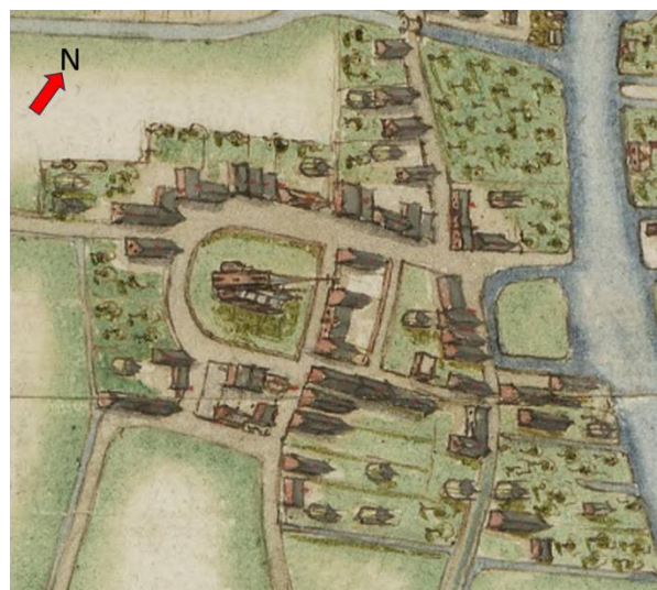
detail kaart van Bilderdijck

er zich ten noorden, westen, zuiden en ten oosten van het perceel bevond; het heeft veel aktes en puzzelwerk gekost om het toenmalige dorp en bewoners gezicht te geven.