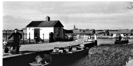
het nieuwe Veerponthuisje.

In 1959 kwam er een nieuw ponthuisje, opgetrokken in steen. Het "luxe" onderkomen behield dezelfde functie. Nog steeds is de pontbaas in voor een praatje.