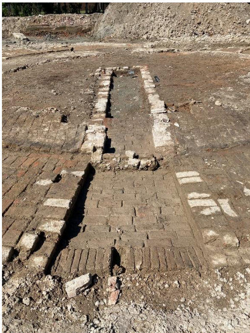
De stooggaten en de vloeren zoals hier te zien is, waren grotendeels nog intact.

De funderingen zijn meer dan een meter dik, de bakstenen vloeren nagenoeg intact en deels verglaasd door de immense hitte van het eeuwenlange gebruik. In de vloer zijn zelfs nog de gootjes zichtbaar waarin arbeiders ooit de gebluste kalk uitschepten – de kalk die eeuwen geleden lang een belangrijke grondstof vormden voor de bouw, in het bijzonder het pleisterwerk. Dat er in dit gebied kalkovens hadden gestaan, was historisch gezien geen verrassing. In de beschikbare archiefbronnen was sprake van drie ovens. Verrassend was de vondst van een vierde kalkoven.