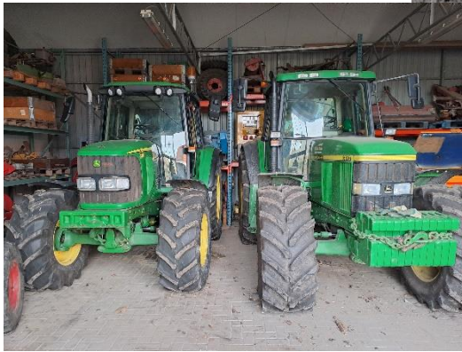
tot H.D. de Vries.

Ons Valkenburg is al eeuwen lang een mooi dorp. Begin 20 e eeuw was het nog een klein dorpje binnen enorm veel (tuinders-)grond. Denk hierbij aan 't Joght, Duyfrak, de Bonksem, de Woerd enz. Veel land dus en dus ook veel kwekers, tuinders en boeren. Veel van dit land moest natuurlijk tussen de oogsten door (en afhankelijk van het seizoen) bewerkt worden.