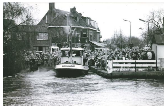
De intocht van Sinterklaas.

Hoogtepunt voor het Veerpad is de derde zaterdag van november.