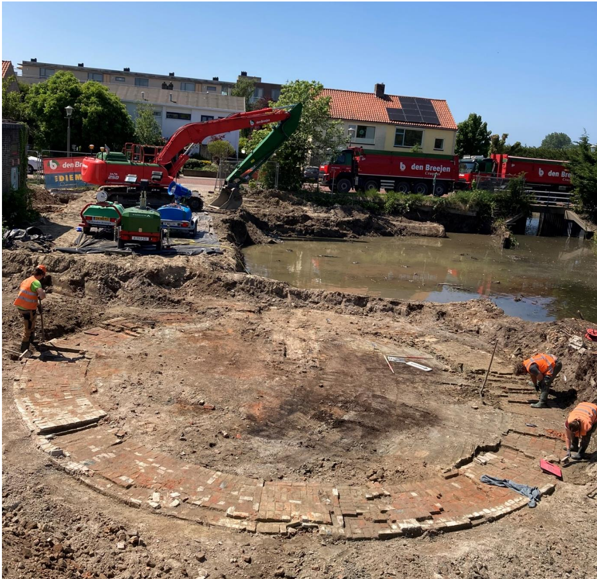
Aan de noordzijde van het terrein resten van diverse kalkovens, waaronder deze die reeds in de 17e eeuw is gebouwd.

In de bodem van Valkenburg zijn resten van een verdwenen belangrijke industriële tak van Valkenburg aan het licht gekomen. Archeologen stuitten bij opgravingen in april en mei dit jaar op niet één, niet twee, maar liefst vier imposante kalkovens – eeuwenoude industriële reuzen, verscholen net onder de oppervlakte van het voormalige Uxem-terrein. Daarnaast kwamen de resten van een eeuwenoude pannenbakkerij aan het licht.