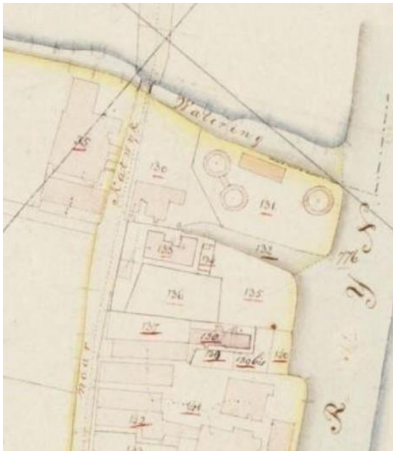
plattegrond van het gebied in 1821

Twee van de vier ovens zijn gebouwd aan het begin van de 17e eeuw en bleven tot in de 19e eeuw in gebruik – ruim drie eeuwen lang. Het geeft een indruk van de degelijkheid van de constructie én de continuïteit van de lokale kalkproductie. Archeologen vonden ook de resten van een bijgebouw bij de ovens. Vermoedelijk is dit het zogenaamde blushuis geweest, waar de kalk geblust werd met water