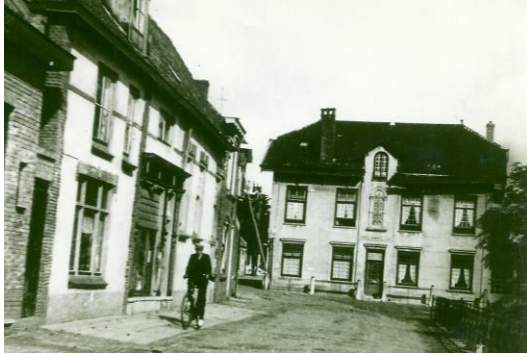
het herenhuis RIJN-RUST.