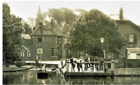
de hangplek voor jongeren.

in de jaren dertig. Nu nog wordt er afgesproken "zo en zo laat bij het pontje".