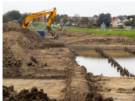
graven en schaven naar Romeins verleden

Tevens werd er geïnvesteerd in vrachtauto's om stukgoed voor derden te vervoeren. Er werd veel gereden van en naar de haven van Rotterdam met zogeheten 'deelpartijen'. Regio Rotterdam was qua verkeer wel even wennen, wat dat was andere koek dan 'de lokale verkeersdruk' in Valkenburg en omgeving. Veel transport is verricht voor muziekinstrumentenfabriek 'Adam'; aan het buitenland verkochte instrumenten moesten vanuit Thorn (later Ittervoort) vervoerd worden naar hoofdzakelijk haven Rotterdam voor het vervoer over zee. In de jaren '85-'88 is de firma nadrukkelijk betrokken geweest bij de archeologische opgravingen langs de Achterweg (vh Praetorium Agrippinae). Er werd daar toen volop onderzoek gedaan naar restanten en overblijfselen uit de Romeinse tijd voordat de Tjalmaweg aangelegd zou worden.