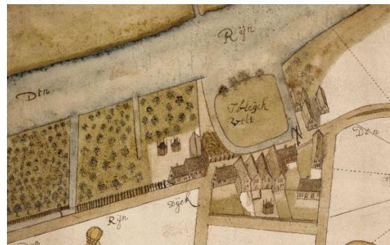
detail plattegrond uit 1630.

In 1619 vraagt de Heer van Valkenburg Johan de Hertoge aan de Staten van Holland toestemming om een tarief voor het Valkenburgse Veer vast te stellen. De oude penning is geen wettig betaalmiddel meer en er ontstaan "kijvagiën en vegterijen" rond het pontje. Met andere woorden: er wordt gescholden en gevochten.