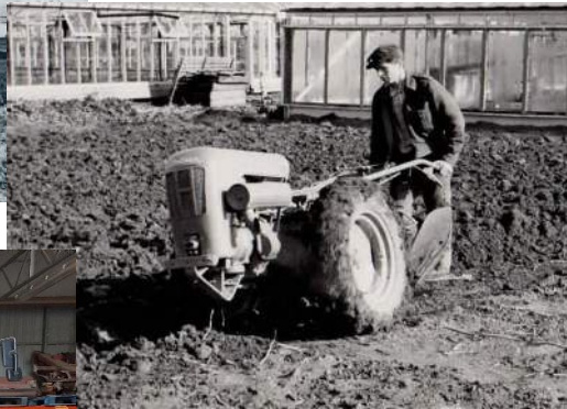
naar H.A. en Zn